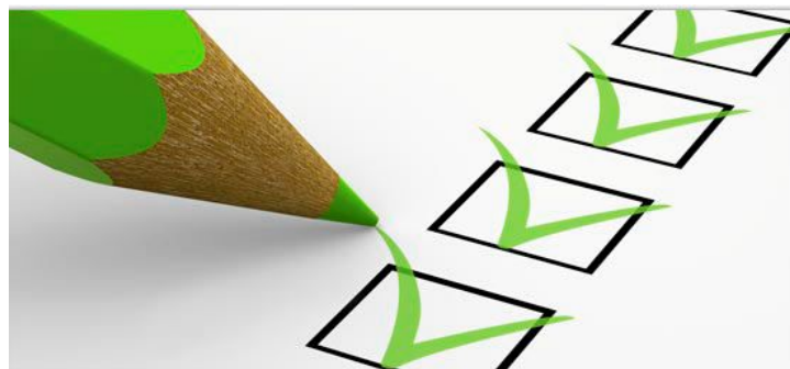
inkassolution setzt einen Akzent nach dem anderen

inkassolution gelang, dem Inkasso ein neues Image zu verleihen. Schuldner und Gläubiger dürfen ihr Gesicht wahren und die bislang gute Atmosphäre bleibt bestehen. Die angenehme Geschäftsphilosophie des schweizerischen Dienstleisters aus Hünenberg setzt Akzente in der Branche der Inkassodienste. Das in 2009 gegründete Unternehmen berücksichtigt die